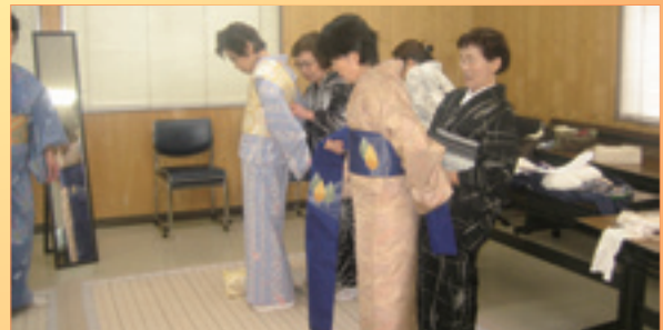
家事援助班2グループの着物着付け研修