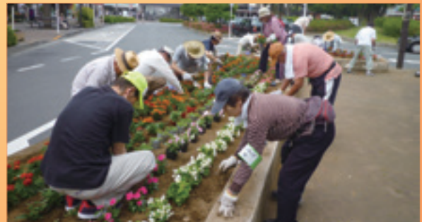
緑のボランティアで、市内の花植え作業を実施!