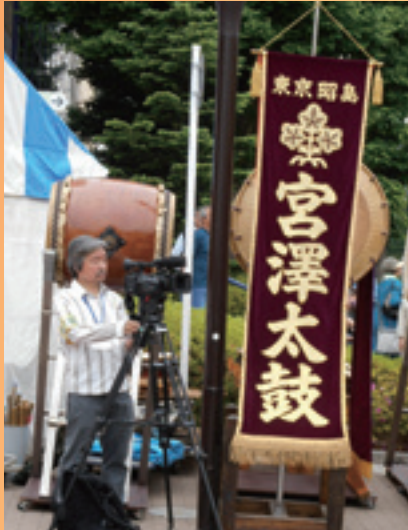
昭島郷土芸能まつり(5月25日開催)映像制作グループが出勤!

▲新規に用意された就業用キャップ。男性用、女性用があり、制帽がなく、業務に支障のない場合に被って欲しい。センター事務局で就業者に貸し出し中！