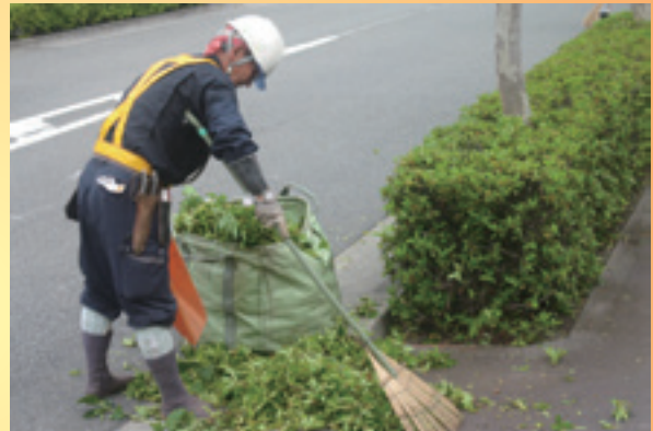
植木班の市道植込樹内刈り込み作業