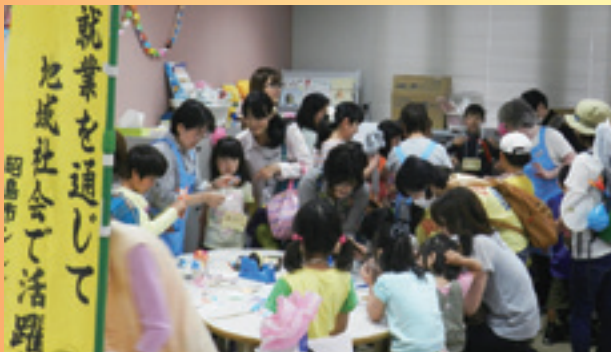
あきしま社協子どもまつり(5月25日開催)の当センターブース