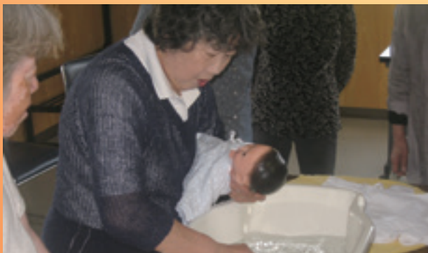
家事援助班3グループは今年も沐浴研修で子育て支援をアピール