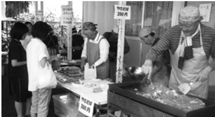
昨年の昭島シルバーふれあい祭りの風景

また恒例の模擬店にバーベキューコーナーが加わる予定です。さらに無料ドリンク券を、9月11日(木)の理事・地域班長全体会議にて各班長に配布し、会員にお届けします。(当日限り)