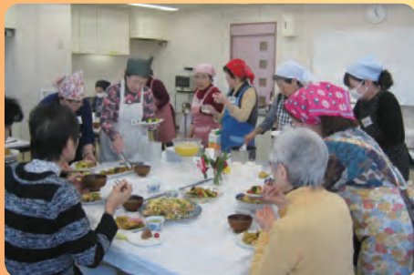
会員増強検討委員会の料理と食事の会