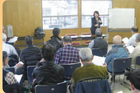
12回に分けて実施された接遇研修