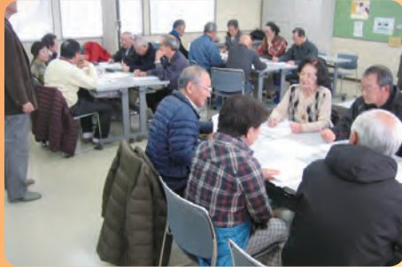
安全支援員会議でのグループ討議