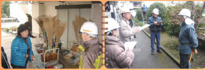
安全巡回点検中の安全管理委員