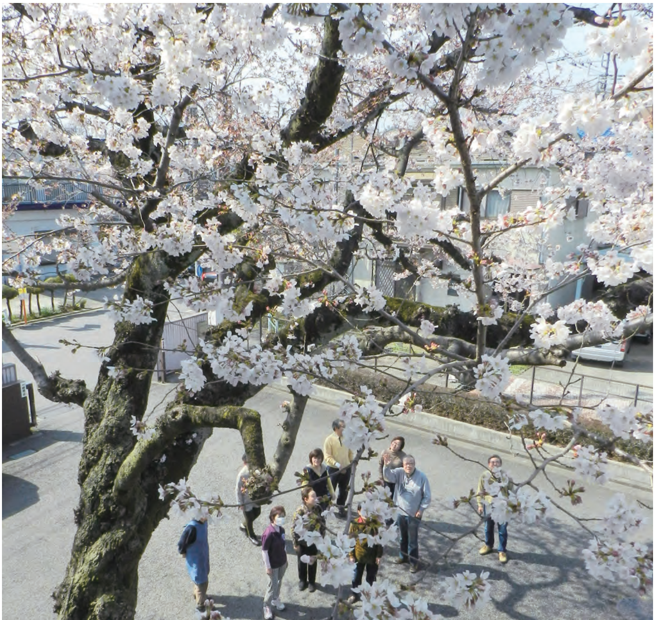
老朽化のため伐採が内定。今年が見納めのセンター前桜

〒196-0022 東京都昭島市中神町2丁目32番18号 電話 042-544-7060 FAX 042-543-9272 ホームページ：http://www.akishima-sc.or.jp/