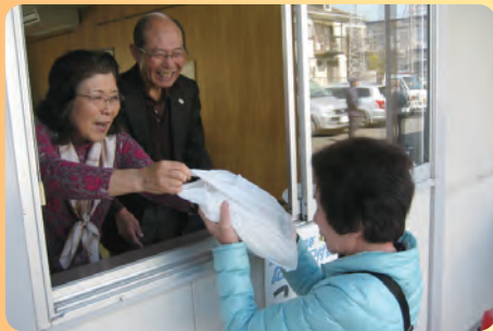
40周年記念品岩手県産のお米を配布