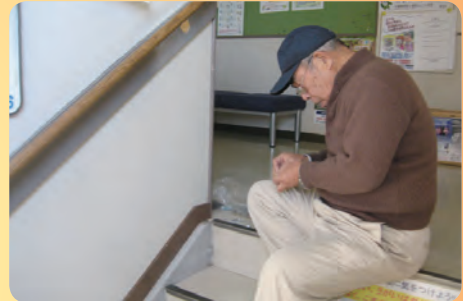
大工仕事のプロがセンターの階段手すりを修理