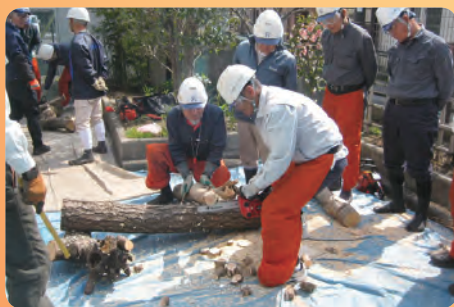
植木班のチェーンソーの安全講習会