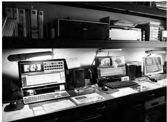
内野リーダーの自宅編集室

そんな長年の地道な作業の積み重ねを耳にした昭島市の広報課から「市の魅力を各方面に伝えるビデオを！」という注文がきました。そしてどんな作品を作るか、市内各地からロケハンして集めた画像を前に『水』をビデオ化するにはどうしたらいいのか話し合っていました。市からの注文は、3分のビデオ作品で、これを市のホームページやYouTubeへの投稿で多くの人に、昭島の魅力を知ってもらおうという戦略の一環です。