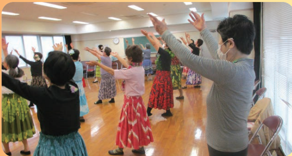
華やかなフラダンス教室 (イキイキ・ニコニコ介護予防教室)