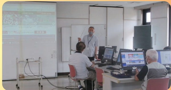
熱のこもったインターネット教室 (イキイキ・ニコニコ介護予防教室)