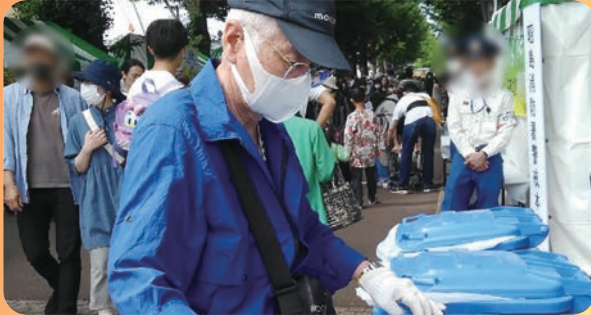
郷土芸能まつりの清掃作業