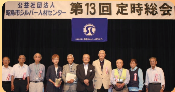
出席された表彰会員と光富会長