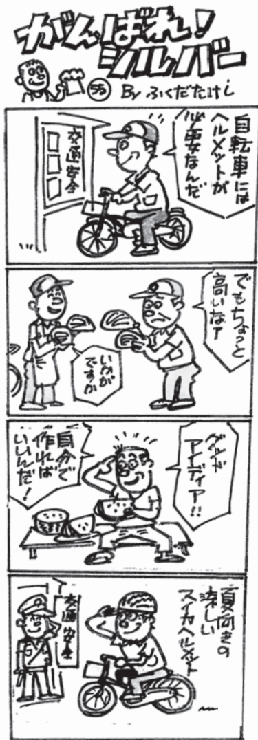
※ヘルメットは「安全基準を満たしたヘルメット」を推奨します。