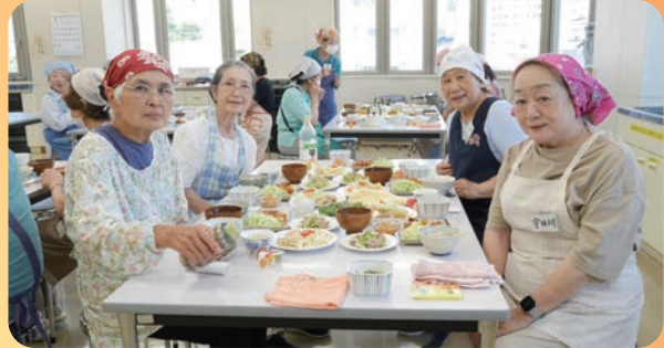
和やかな調理実習