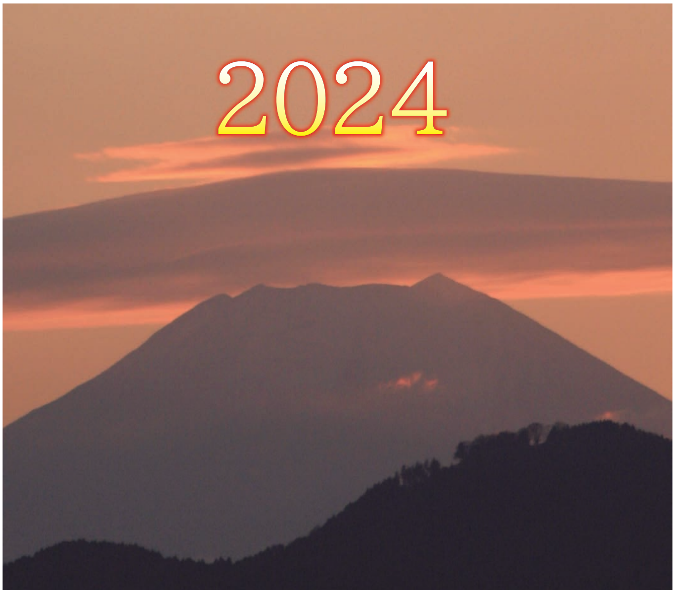
場所：市内拝島駅近郊

〒196-0022 東京都昭島市中神町2丁目32番18号 電話 042-544-7060 FAX 042-543-9272 ホームページ 昭島市シルバー人材センター