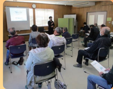
11月開催の接遇研修