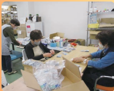
内職作業 (パッケージ取替作業)