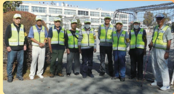
パトロール・ボランティア (清泉中地区合同パトロール)