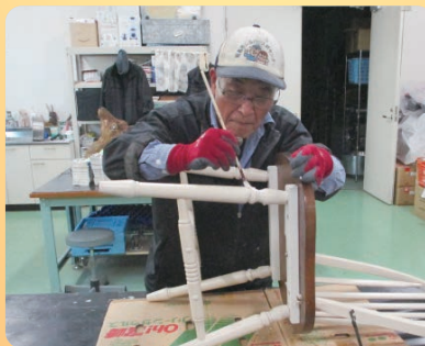
粗大ゴミ再生業務