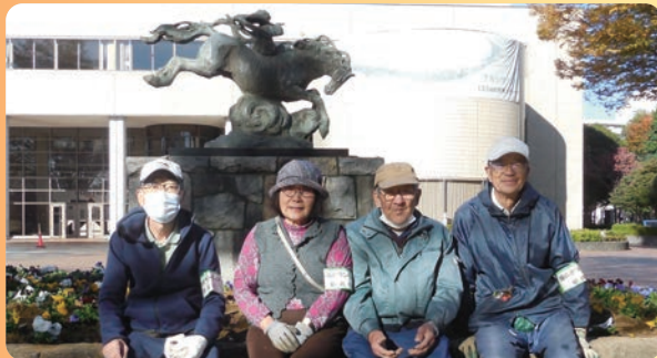
みどりのボランティア