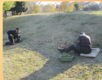
エコ・パークにてクローバーの草とり作業